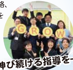
伸び続ける指導を一。

幼・小・中・高・大…子どもたちが学び、自信をつけ、伸び続ける上で大切な教育を、今後とも追及していきます。「時代に必要な確かな学力」を身につけていただけるよう、精一杯ご指導させていただきます。